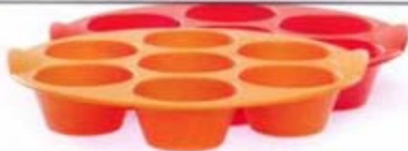
Moule à muffins + dépliant recettes 31,95 € - 28,55 € (ID15) orange (ID16) rouge