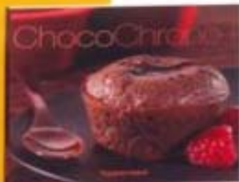
Leur ChocoChromo (ID19) 18,95 €