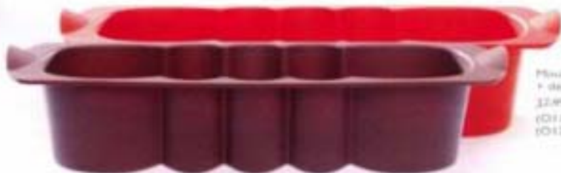
Moule à cake + dépliant recettes 31,95 € - 28,15 € (ID11) chocolat (ID12) rouge