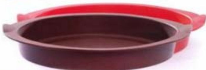
Moule à macarons + dépliant recettes 33,95 € - 31,95 € (ID13) chocolat (ID14) rouge