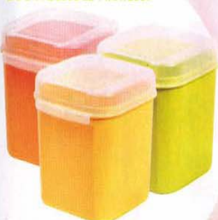
Set 3 Boîtes Signature hautes