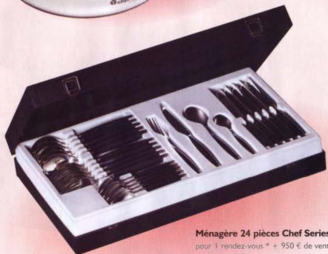
Ménagère 24 pièces Chef Series™ + Livret pour 1 rendez-vous * + 950 € de ventes.