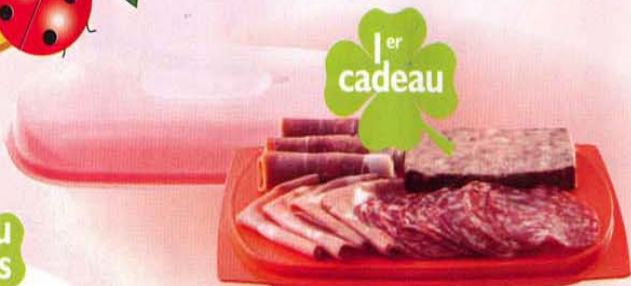
Cave à charcuterie Slim lorsque je décide d'organiser un Atelier.