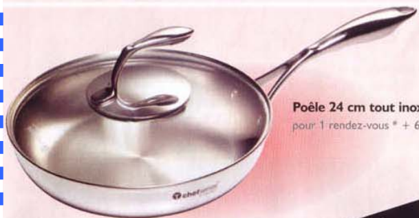
Poêle 24 cm tout inox Chef Series™ pour 1 rendez-vous * + 690 € de ventes.