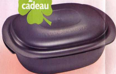
Le jour de mon Atelier dès 1 rendez-vous * + 250 € de ventes OU 290 € de ventes, je reçois :