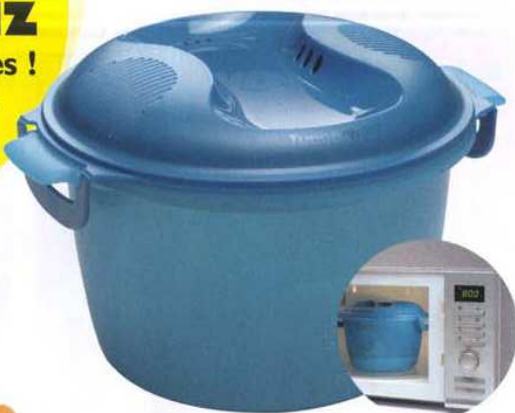
Cuiseur à riz micro-ondes + Fiche recettes (O89) 24.99 €

Pratique, rapide (8 à 12 mn) et intuitif, il s'occupe de tout et vous vous occupez de vous.