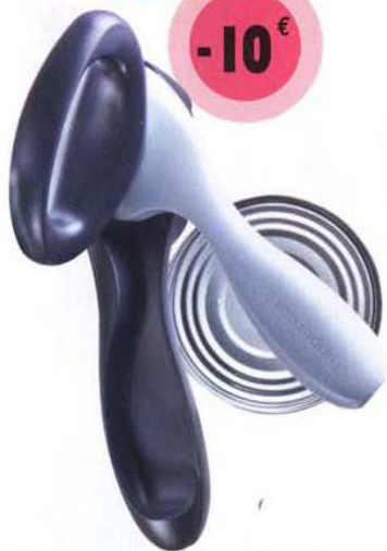
Dessertisseur + Egouttoir malin

Dessertit les boîtes de conserve en laissant les bords non coupants. L'Egouttoir malin, petit et pratique, permet d'égoutter toutes vos boîtes de conserve. (O88) 39.98 € - 29.98 €